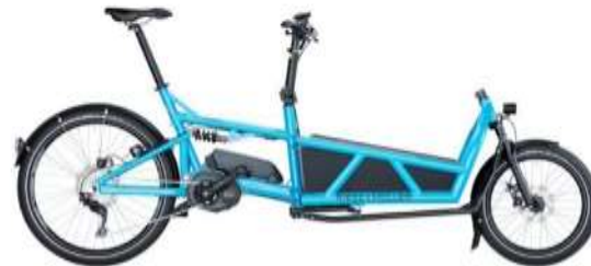
Gyerekszállító, teher kerékpár