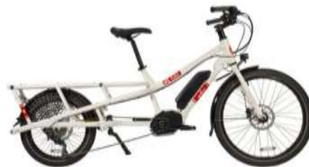
Gyerekszállító, teher kerékpár