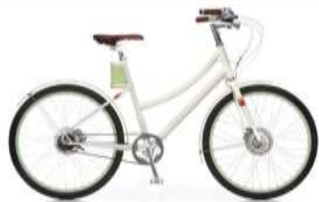
Női design kerékpár