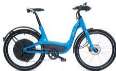
Városi design kerékpár